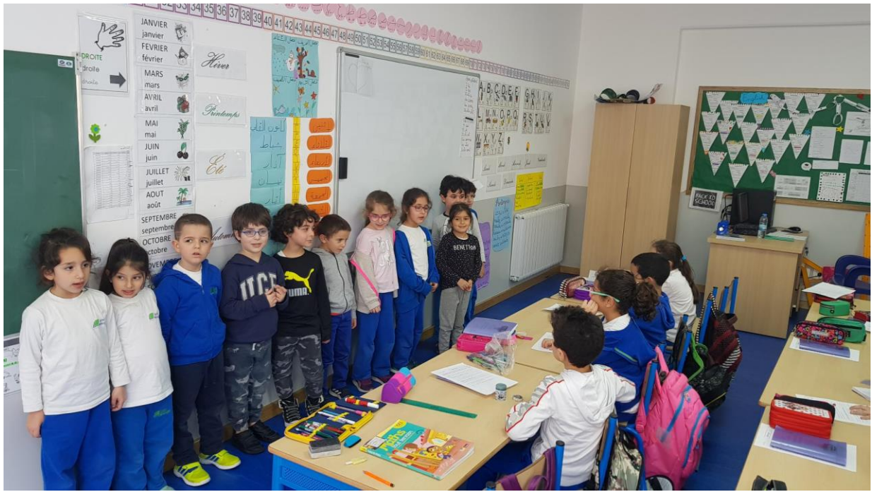
Merci les GSC pour ces beaux partages poétiques !